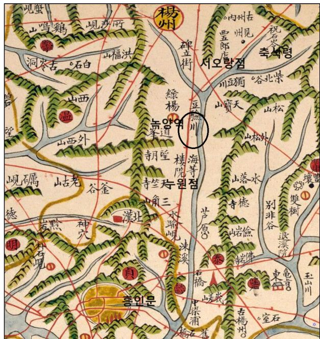
그림 2. 의정부점의 위치(○표시 지역, 출처 : 『동여도』)

요컨대, 조선시대 의정부 둔전 관련 기록이 많지 않은 가운데, 조선전기부터 녹양평 일대 관둔전과 역둔전이 설치되어 경작되었을 것으로 생각되며, 『노상추일기』에서 확인되는 ‘의정부점’이라는 명칭을 통해 적어도 적어도 18세기 후반에는 이 일대 의정부 소속 둔전이 경작되고 있었을 것으로 추정된다. 그러나 이때까지만 해도 의정부가 이 일대 자연촌을 대표하는 행정지명으로 쓰이지는 못했다. 『노상추일기』와 비슷한 시기에 작성된 『호구총수』(1789)에는 동시북곡면[일패리]과 남둔야면[일패리, 이패리, 삼패리]에는 의정부리라는 명칭은 확인되지 않는다. 의정부가 행정지명으로 통용되기 위해서는 둔전을 경작하는 농민들의 집단적인 거주지가 이곳에 형성되고 이것이 주민들의 기억 속에 하나의 지역성으로 자리매김되어야 했을 것이다. 이러한 점에서 노상추가 언급한 ‘의정부점’은 공식적인 행정지명이라고 할 수는 없지만, 조선후기 둔전민들의 집단 촌락이 둔전 인근에 형성되면서 이 일대를 지나는 행려객들에게 하나의 자연지명으로 회자되었던 것으로 보인다.