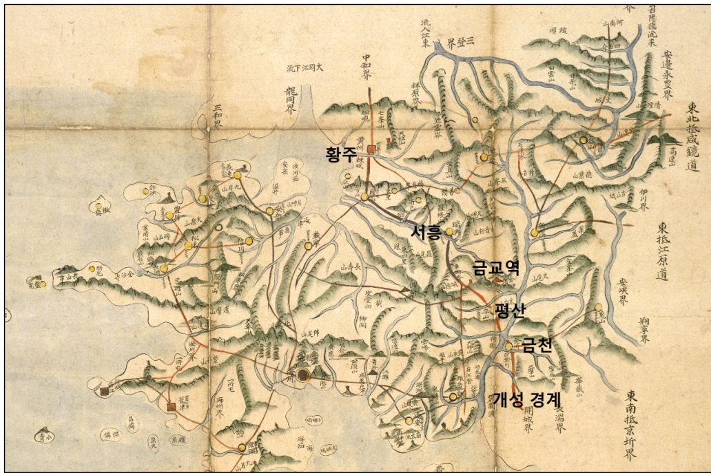
그림 1. 1402년 태종이 태상왕을 마중한 금교역의 위치 (출전: 『팔도지도』 「황해도」(奎4709-23))

이렇게 본다면 이성계가 한양으로 돌아가지 않고 양주군 진접면 내각리의 대궐터에 풍양궁을 건설하여 거주하였다는 서술도 그대로 받아들이기 어렵다. 풍양궁의 경우 『세종실록』에서부터 그 명칭이 확인되는데, 세종대 상왕(태종)이 ‘풍양궁에 돌아갔다’고 하는 설명이 자주 나오고 세종이 직접 풍양궁에 문안한 것으로 보아 풍양궁에 머문 것은 태조 이성계가 아닌 세종에게 양위한 태종으로 보아야 한다. 22)